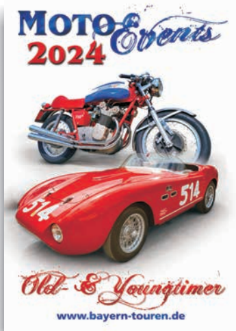
Arbeitstitel 2024 in Arbeit (ITA)