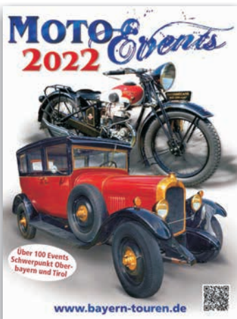
bereits im 6. Jahr